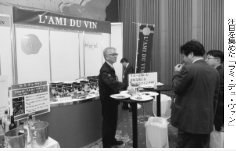
注目を集めた「ラミ・デュ・ヴァン」