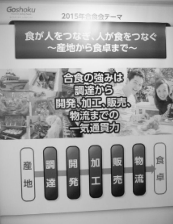
「一貫通買力の提案をアピールした「食合会」